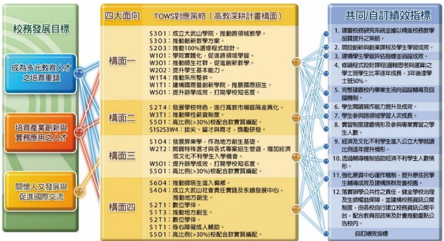
圖2 校務發展目標、SWOT 對應策略及績效指標對應圖

基於校務分析後所得到待改善現況及第一階段高教深耕執行成果檢討，本校校務發展將以「From UGSI to USSR」為推動目標。其中，「From UGSI to USR」為第一階段目標，將合校之初所做的 UGSI 校務整合工作(University + Government + School & Society + Industry & International)具體落實大學社會責任 USR。在第二階段，更進階加入大學學生社會責任(University Students' Social Responsibility, USSR)的目標。本校高教深耕計畫根據本校 SWOT 分析結果，擬定以下 13 個發展策略產生相對應的 13 個子計畫，各個子計畫源自於 3 個校務發展目標，對應高教深耕 12 個共同績效指標、10 個自訂績效指標，如圖 2 所示。