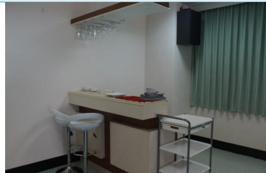
休閒事業經營學系-國際禮儀專業教室