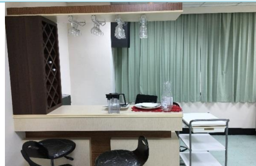
休閒事業經營學系-實習旅行社專業教室