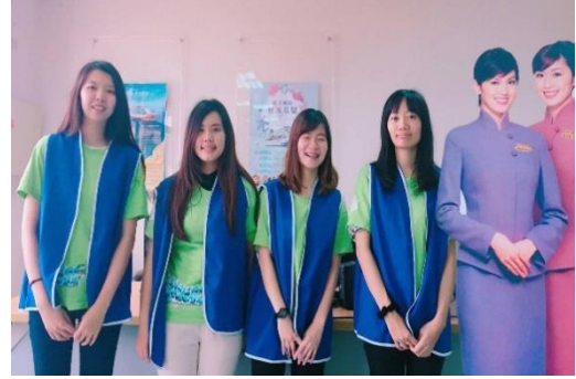
休閒事業經營學系-休創園區-下午沒課(After Class)