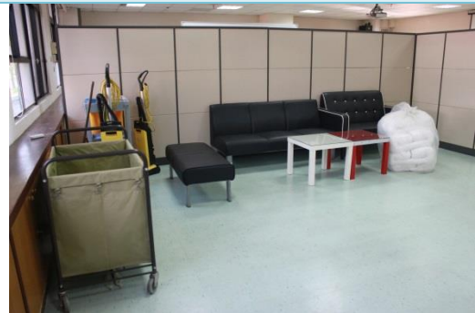
休閒事業經營學系-房務專業教室