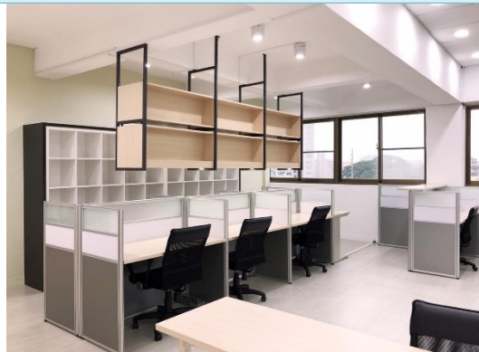
說明：USR 專案助理行政空間