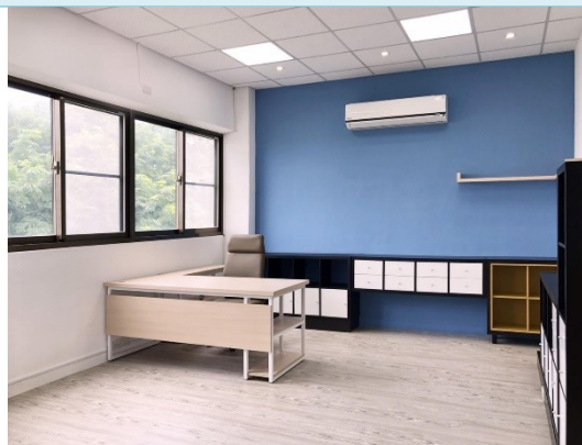
說明：主管辦公空間