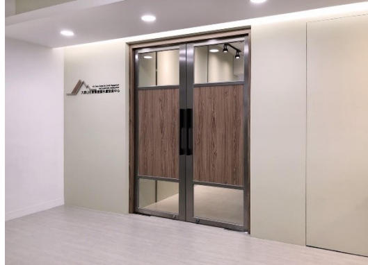
說明：大武山社會實踐暨永續發展中心入口

位於民生校區，教學科技館5樓，此單位原為研發處下(2019.11.8成立)，自大武山學院成立後納入組織中，2020年9月23日移至教學科技館新空間啟用。