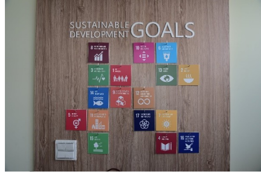
說明：牆面有聯合國 SDG 指標