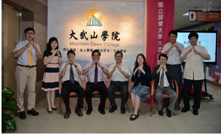
說明：2020年7月30日大武山學院揭牌成立。

位於屏商校區行政大樓4樓，學院辦公室為原通識教育中心，109學年度(2020.8.1)共同教育組、博雅教育組改制為中心，並新增「跨領域學程中心」於此。並將2019年11月8日成立之「大武山社會實踐暨永續發展中心」也納入，成立「大武山學院」。