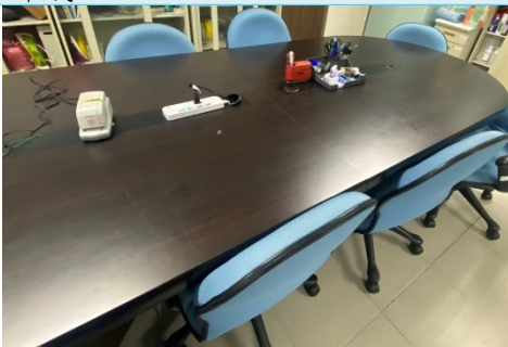
說明：院會議桌提供開放式洽空等候與討論空間。