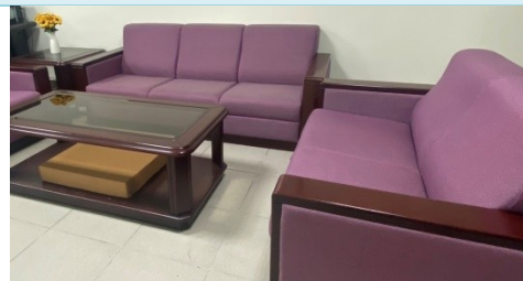
說明：訪客/貴賓接待區